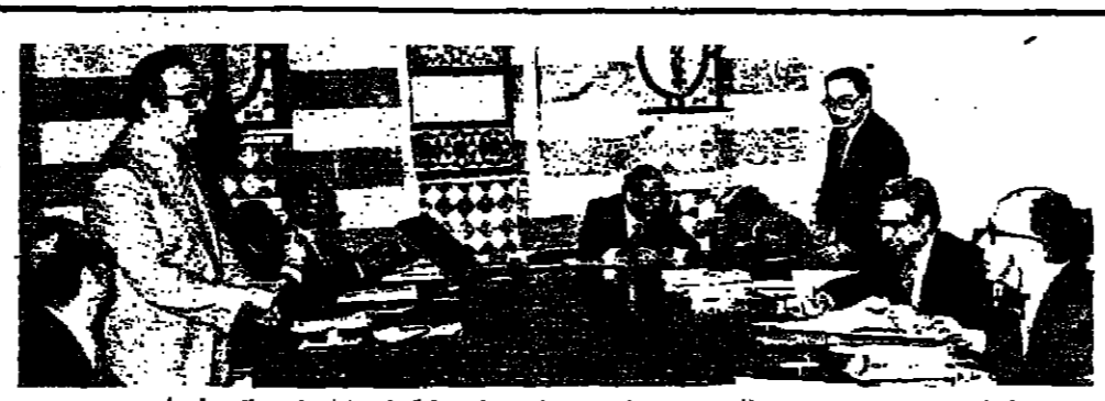
الرئيس سركيس يستمع السيد حريش الوزير بطرس في بداية اجتماع مجلس الوزراء أمس

عقد السيد الشيخ بيار الجميل اجتماعاً مع وفد من اللجنة الوطنية اللبنانية التي تتولى التفاوض مع إسرائيل، وأكد على أهمية التمسك بمبدأي المقاومة والوحدة. عقد السيد الشيخ بيار الجميل اجتماعاً مع وفد من اللجنة الوطنية اللبنانية التي تتولى التفاوض مع إسرائيل، وأكد على أهمية التمسك بمبدأي المقاومة والوحدة، وقال إن لبنان لن يقبل التفاوض على أساس المساواة، وأنه سوف يتخذ الإجراءات اللازمة في حالة حدوث أي تغييرات. ألقى السيد الشيخ بيار الجميل كلمة أكد فيها على أهمية التمسك بمبدأي المقاومة والوحدة، وقال إن لبنان لن يقبل التفاوض على أساس المساواة، وأنه سوف يتخذ الإجراءات اللازمة في حالة حدوث أي تغييرات.